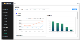
iBBOMS1000业务编排管理能力系统